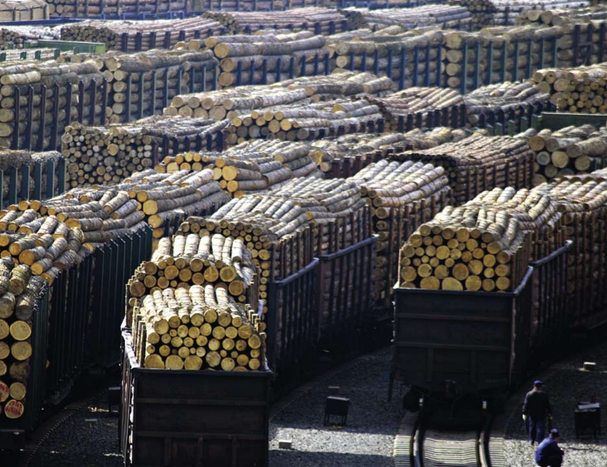
Environmental Investigation Agency