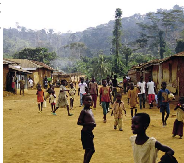
Marc Parren / Tropenbos International Congo-Basin Programme