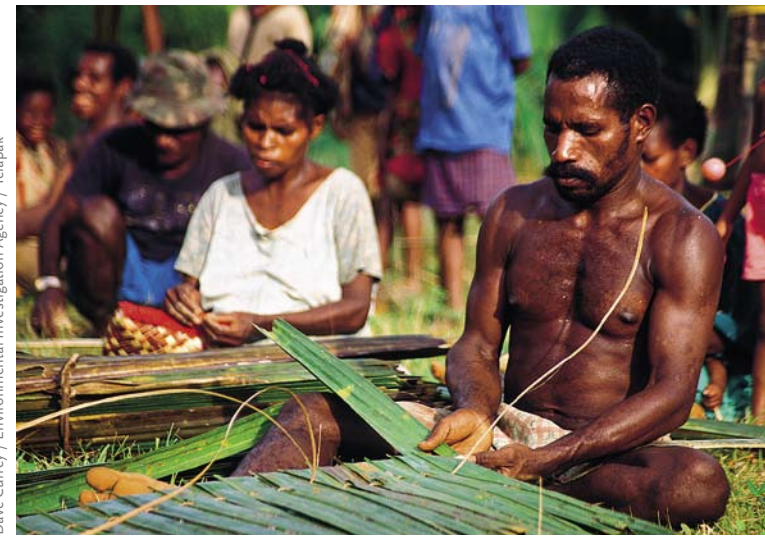
Villageois fabriquant des nattes pour leurs maisons, Manggroholo, Papouasie Occidentale.