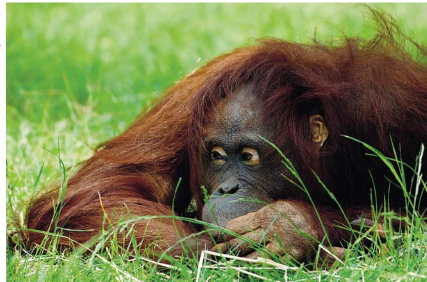
Le mot orang-outan est dérivé des mots malais et indonésien oran qui signifie « person » et du mot hutan qui signifie « forêt ». Les orangs-outans sont en grand danger à Sumatra et en danger à Bornéo, selon la Liste Rouge des mammifères de l'Union Mondiale pour la Nature.