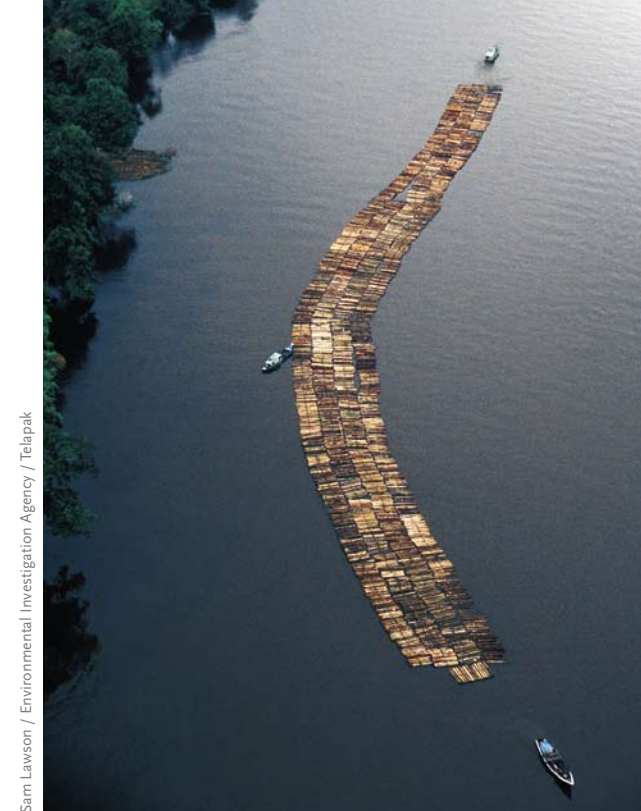
Sam Lawson / Environmental Investigation Agency / Telapak