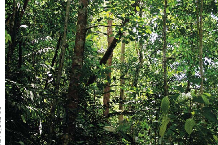
Sous-étage dense dans la forêt tropicale du Parc National de Bako, à Sarawak en Malaisie.